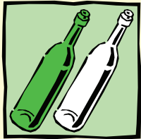
Bunt- bzw. Weißglasbehälter